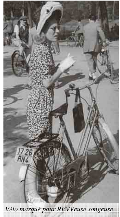
Vélo marqué pour REVVeuse songeuse

Or il se trouve qu'ailleurs la lutte contre le vol des vélos est beaucoup plus efficace. Au Danemark comme dans certaines régions d'Allemagne, 40% des vélos volés sont retrouvés et restitués à leur propriétaire contre 1 à 2 % en France ! La raison en est une meilleure organisation de la gestion des vols et de leur déclaration.