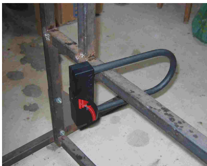
le banc d'essai installé par REVV

Le niveau 2 est attribué aux antivols qui résistent aux effractions utilisant des outils plus agressifs mais moins discrets (dimensions inférieures à 60 cm), dans un temps donné. Il correspond à des vols dans des lieux à l'écart des témoins ou la nuit.