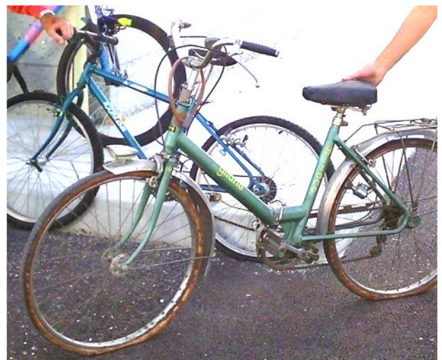
Exemple de vélo tel que récupéré à la déchetterie

Aspect environnemental : si le tri et le recyclage des déchets sont à encourager, il faut bien être conscient que ce n'est qu'un palliatif. Le meilleur déchet... c'est celui que l'on ne produit pas : toute solution de "réutilisation" est écologiquement bien meilleure qu'une solution de "recyclage". En donnant une seconde vie à ces vélos, on préserve les ressources naturelles qui seraient nécessaires pour en fabriquer de nouveaux, mais aussi l'énergie qui serait nécessaire à leur recyclage (par exemple pour fondre le métal pour sa récupération).