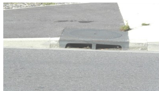
Exemple d'avaloir intégré au trottoir

Quel est le cycliste qui n'a pas pesté contre ces grilles ou avaloirs d'eau pluviale enfoncés dans la chaussée et qui provoquent un choc au passage du vélo et quelquefois, plus grave, un écart important de la trajectoire du cycliste. Outre l'inconfort, les conséquences peuvent être une crevaison par pincement de la chambre à air, une chute et un écart important au risque de se faire accrocher par un automobiliste ou, plus grave, un poids lourd.