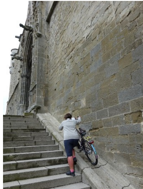
Les édifices précurseurs du moyen âge...