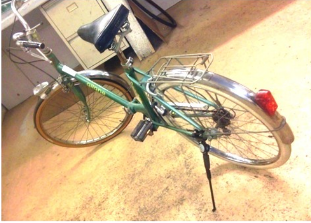
Le même vélo après rénovation