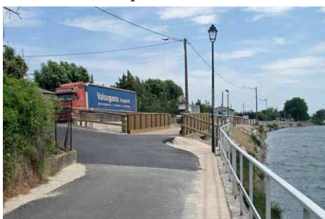
La passerelle le long de la N7 à Tain