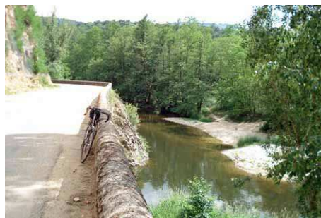
Le Doux entre Arlebosc et Boucieu