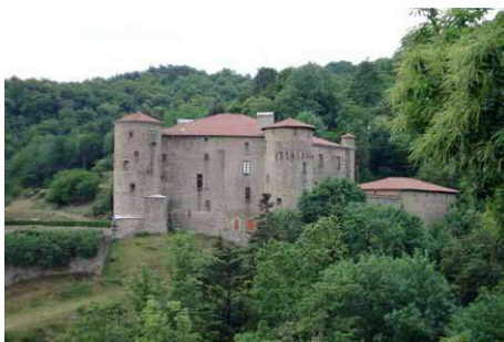
Château des Bosc, près du col de St Genest

Randonnée de 98 km et 990 m de dénivelé. Départ assez conventionnel par la route du tram en direction du Pin, puis, au Fringuet, prendre la direction de Gilhoc-sur-Ormèze (D269). Traverser l'Ormèze et tourner à gauche vers Lamastre où on reprend à droite puis à gauche en direction de Saint Félicien (D578). A la sortie d'Arlebosc, tourner à droite vers Boucieu le Roi. En y arrivant, ne pas traverser le joli pont pour rester en rive gauche du Doux, vallée que l'on ne quittera plus. A Tournon, traverser le vieux pont suspendu et suivre la piste cyclable qui longe le Rhône. Le long de la N7, prendre la D220 jusqu'à La Roche-de-Glun, puis, 200 mètres avant le pont, rejoindre Via-Rhône.