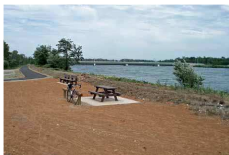
La passerelle sur l'Isère vue du confluent