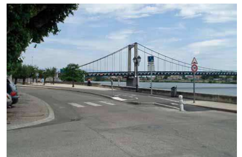
La piste cyclable à Tain-l'Hermitage