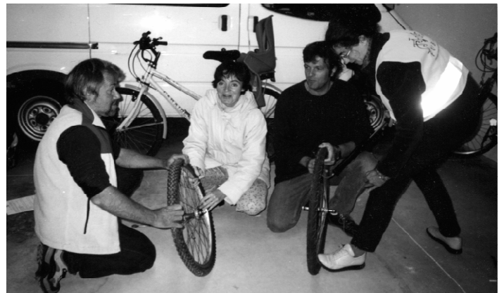
ATELIER VÉLO À LA MPT DU PETIT CHARRAN